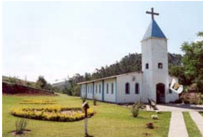
Primer Santuario a Nuestra Señora de la Llama de Amor en Jacarei, Sao Paulo, Brasil.